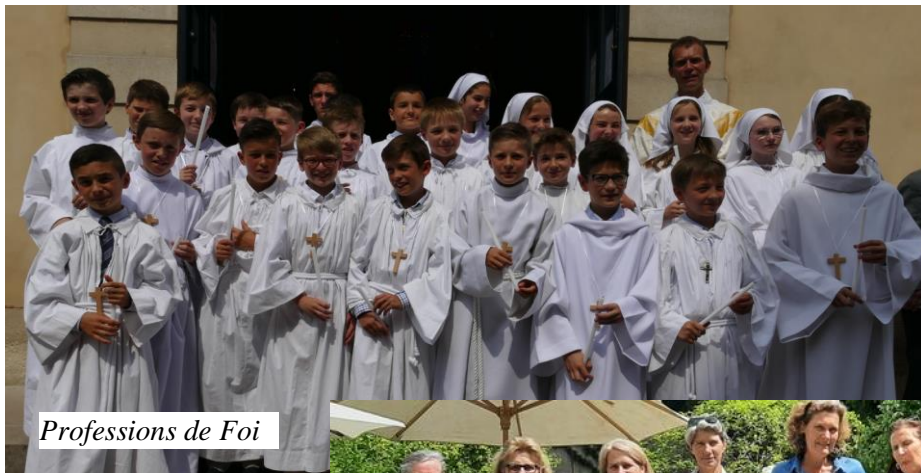
Professions de Foi