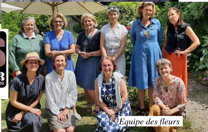
Equipe des fleurs