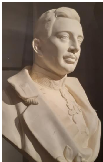
Bienheureux Charles 1 er (1887-1922), empereur d'Autriche (1916-1918)

Comme à Rome, les églises sont à (presque) chaque coin de rue. Accueillis pour notre messe quotidienne dans l'église Saint Roch, nos pas et nos prières nous ont fait découvrir, oratoriens, augustinien, bénédictin, cistercien dans des églises pour la plupart toutes "baroquisées", Notre Dame du Rivage, l'église Saint Charles Borromée, la cathédrale Saint-Étienne, l'église des Ecosais, les abbayes de Klosterneuburg et Heiligenkreuz. En Autriche, empereurs et impératrices ont construit, impulsé, enrichi, doté d'œuvres d'art exceptionnelles nombre de lieux toujours ouverts au culte et