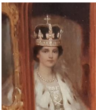
Zita (1892-1989), épouse de Charles 1er