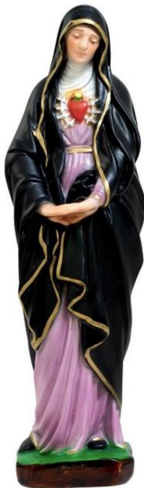
15 sept : Notre-Dame des 7 douleurs