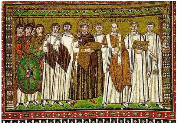
Justinien représenté sur une mosaïque de la basilique Saint-Vital de Ravenne entre ses généraux et le clergé.

Il est admirable de voir comment l'Esprit-Saint s'appuie sur tout cela afin que la foi soit énoncée sans erreur.