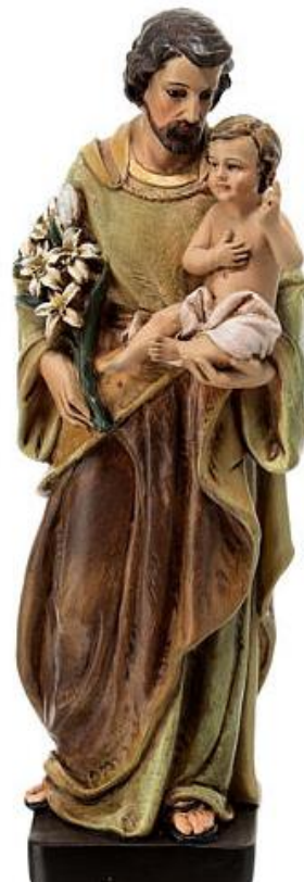
Saint Joseph 19 mars