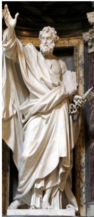
Saint Pierre basilique St Jean de Latran Rome